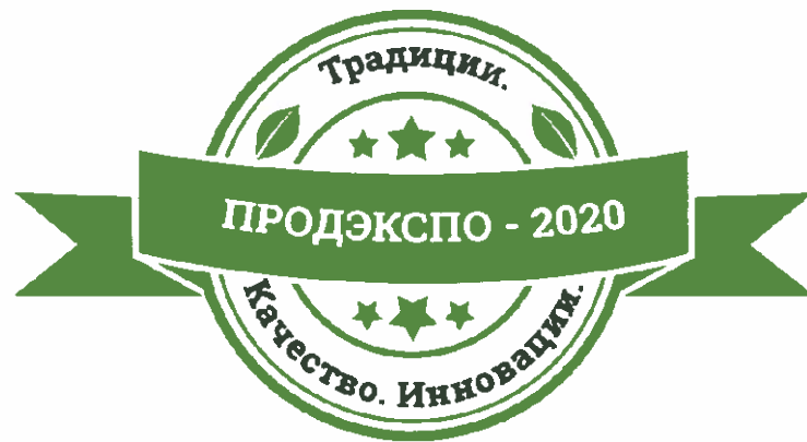
Рис. 1. Логотип